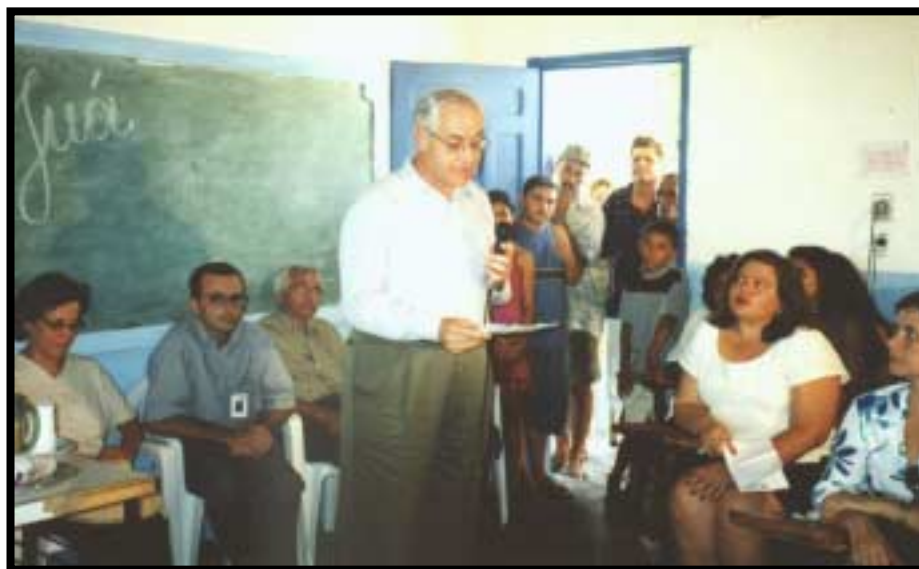
Foto 4 – Visita do Embaixador do Canadá no Brasil ao Juá - Irauçuba