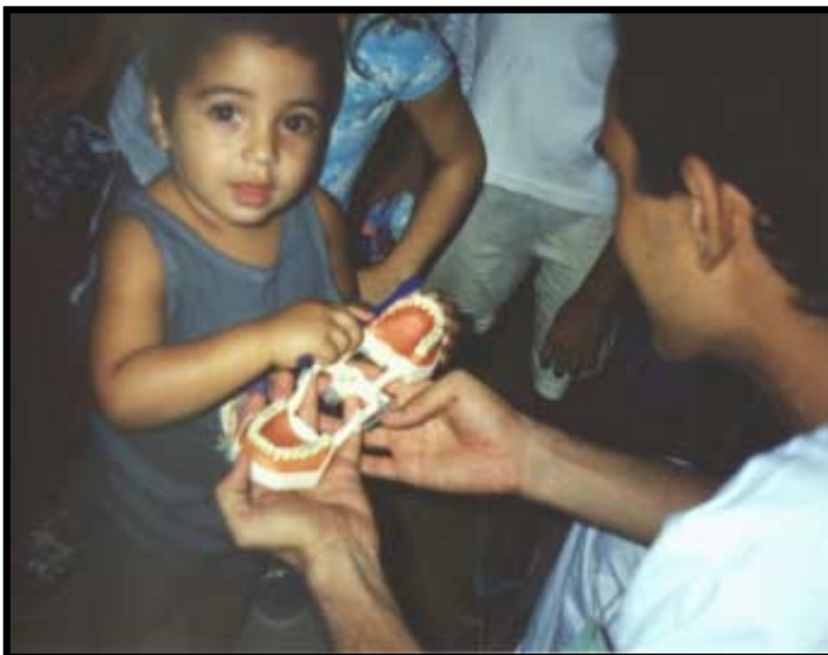
Foto 6 – Oficina de Prevenção à Saúde Bucal Infantil – Juá - Irauçuba